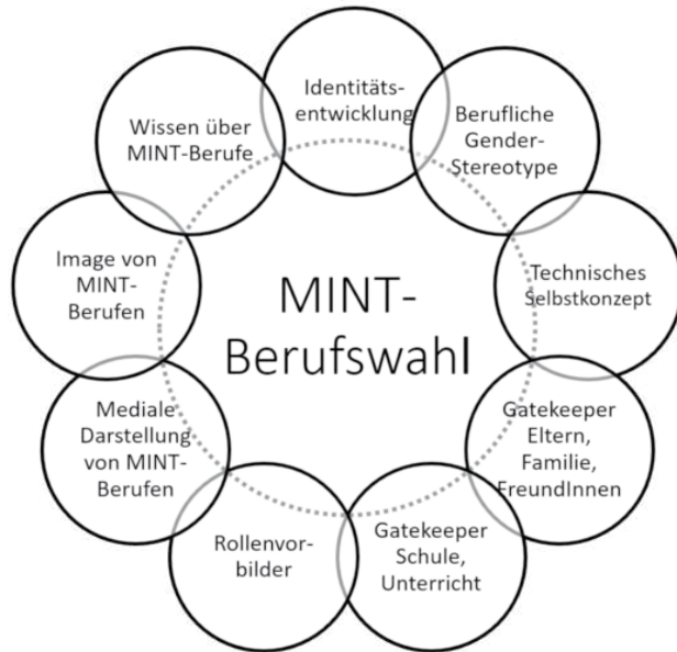
Abb. 1: Einflussfaktoren auf die MINT-Berufswahl