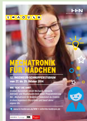
Poster: © Hochschule Heilbronn

Bei diesem Schnupperstudium der Hochschule Heilbronn dient der Bau einer Kurzeituhr als Beispiel, um den teilnehmenden Mädchen mechatronische Systeme und das Zusammenwirken von Mechanik, Elektronik und Informationstechnik näherzubringen. An drei Tagen lernen sie die Grundlagen der Mechatronik kennen und bauen selbstständig eine Uhr, die sie anschließend mit nach Hause nehmen können. www.hs-heilbronn.de/MfM